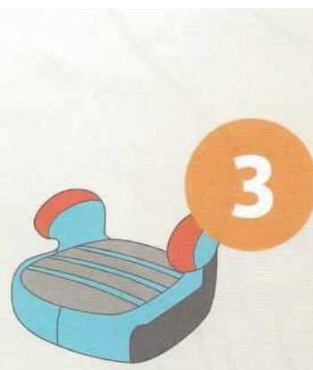
22-36 кг от 6 до 12 лет