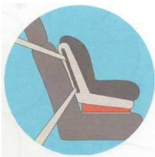
Лицом по ходу движения

Самое безопасное место для установки детского кресла в автомобиле — среднее место на заднем сиденье. Самое небезопасное - переднее пассажирское сиденье. Туда автокресло ставится в крайнем случае, при обязательно отключенной подушке безопасности.