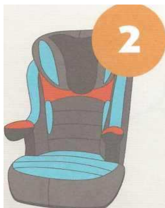
15-25 кг от 3 до 7 лет