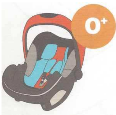
0-13 кг от рождения до 1 года

Покупайте кресло вместе с ребенком. Пусть он попробует посидеть в нем - прямо в магазине.