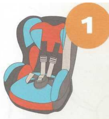
9-18 кг от 9 месяцев до 4 лет